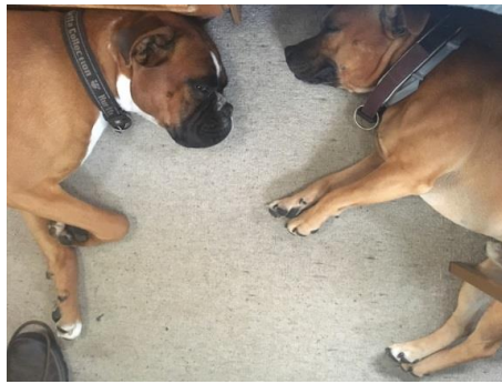
Trætte bedste venner ☺

Da første dag var gået, var de to hunde meget, meget trætte. De havde haft mange pauser i løbet af dagen, men det var en ny verden for dem at lære at tilbyde en adfærd. Så deres hundehjerner var godt udfordret og brugte ☺