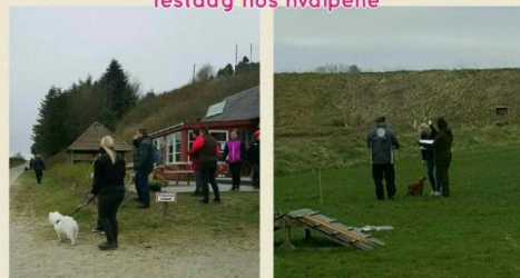
Det summer af liv i klubben