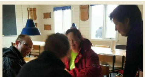
Testdag hos hvalpene